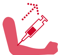
Prelievo di sangue